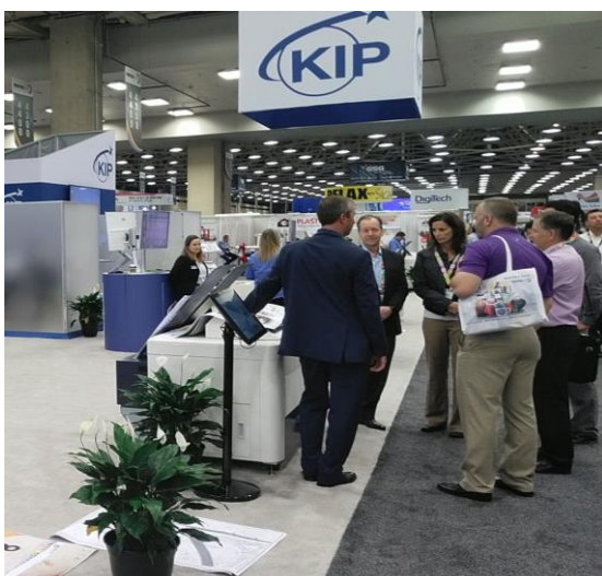
KIP 600 Series

We thank you very much for visiting and interest on KIP stand in Printing United 2019.