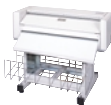
■ KIP500 ファンフォルダ