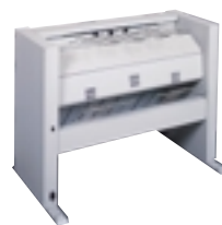
■ KIP200 オートフォルダ

*本体価格には感光体(ドラム)は含まれておりません。 *別途必要となりますサポートサービス料金に含まれております。 *表示価格に消費税は含まれておりません。別途消費税相当額を申し受けます。 *製品改良のため、仕様および外観の一部を予告なく変更する場合があります。